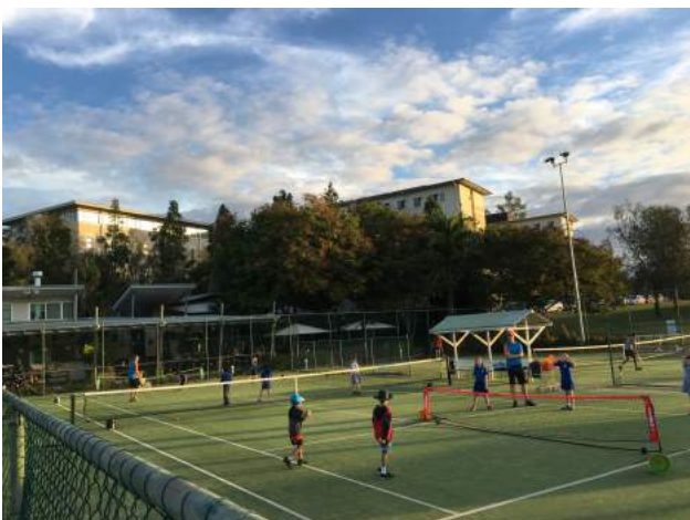
キッズのレッスン風景