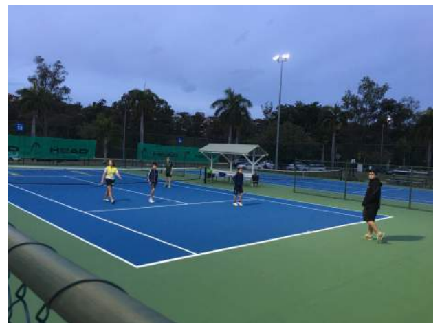
ジュニアのレッスン風景