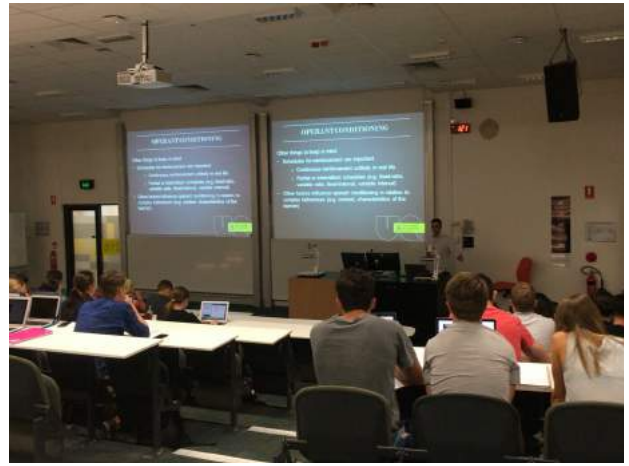
スポーツコーチング理論 授業風景

演習の授業の際にはテニスの指導に関してはテニスコーチが付き、SAと教員の3名で展開しています。