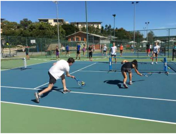
スポーツコーチング演習 授業風景 2