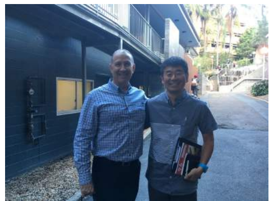
クリフマレット教授と