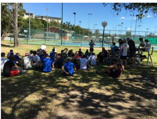
スポーツコーチング演習 授業風景1

11日に大学に行ってからにはスポーツコーチング理論、演習とスポーツ心理学の授業に参加しています。特に理論を学んでから実際に演習を行っているところはとてもわかりやすく参考になりました。演習に関してはテニスという運動を通して、授業を展開をしていたので私も参加しています。このスポーツコーチングは、タームの前半はスポーツ心理学の面から、後半は教育学の面から展開になります。